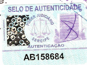
Tabella "Válido somente com selo de autenticidade"

Cetifico que o presente instrumento é cópia fiel do original que me foi exibido. Em testº. (Assinatura) da Verdade. Poço Verde, 17 de 04 de 2001.