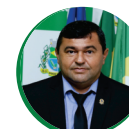
RAIMUNDINHO PRESIDENTE PSB